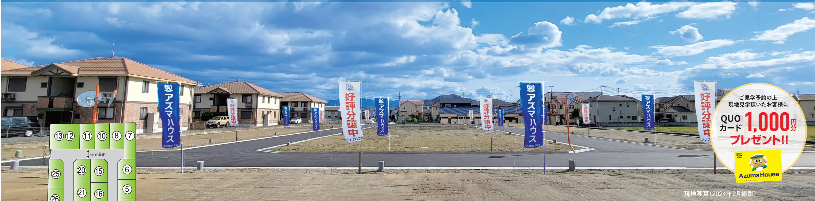
現地写真 (2024年2月撮影)